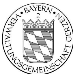
Klaus Hoffmeister Verwaltungsrat

Im Internet veröffentlicht: KW 8 Veröffentlichung im Vilstalbote: KW 8/9 Aushang / Magnetwand: KW 8