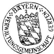
Konrad Hartshauser Gemeinschaftsvorsitzender

Im Internet veröffentlicht am: 28.06.2024